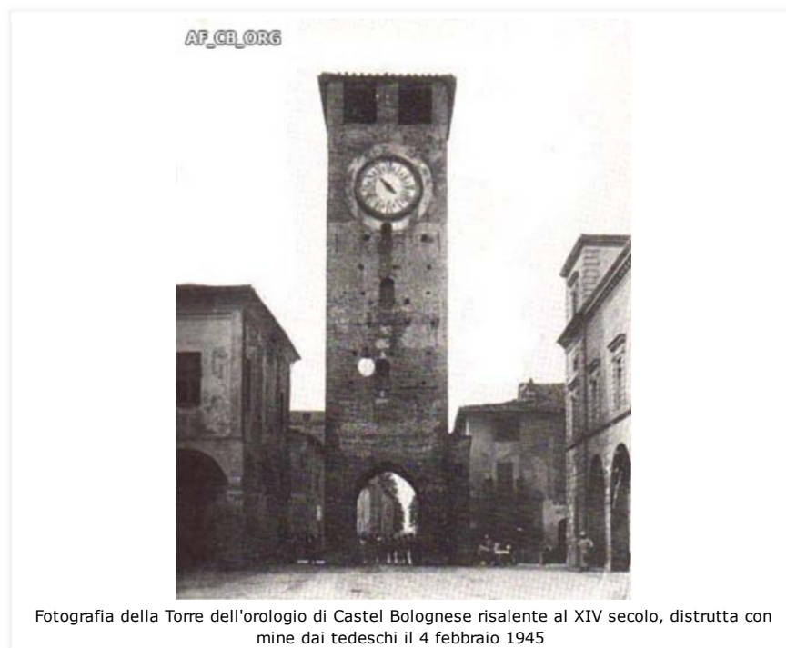
Fotografia della Torre dell'orologio di Castel Bolognese risalente al XIV secolo, distrutta con mine dai tedeschi il 4 febbraio 1945