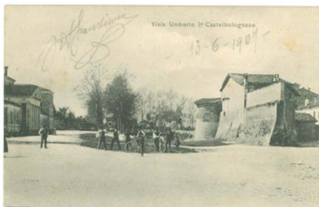
Cartolina degli inizi del Novecento, raffigurante il torrione, risalente al XV secolo, di fronte all'ospedale civile di Castel Bolognese

Che cosa determina l'importanza di un ruolo nella Storia? Si può essere piccoli, insignificanti e tentare di valorizzare la propria storia?